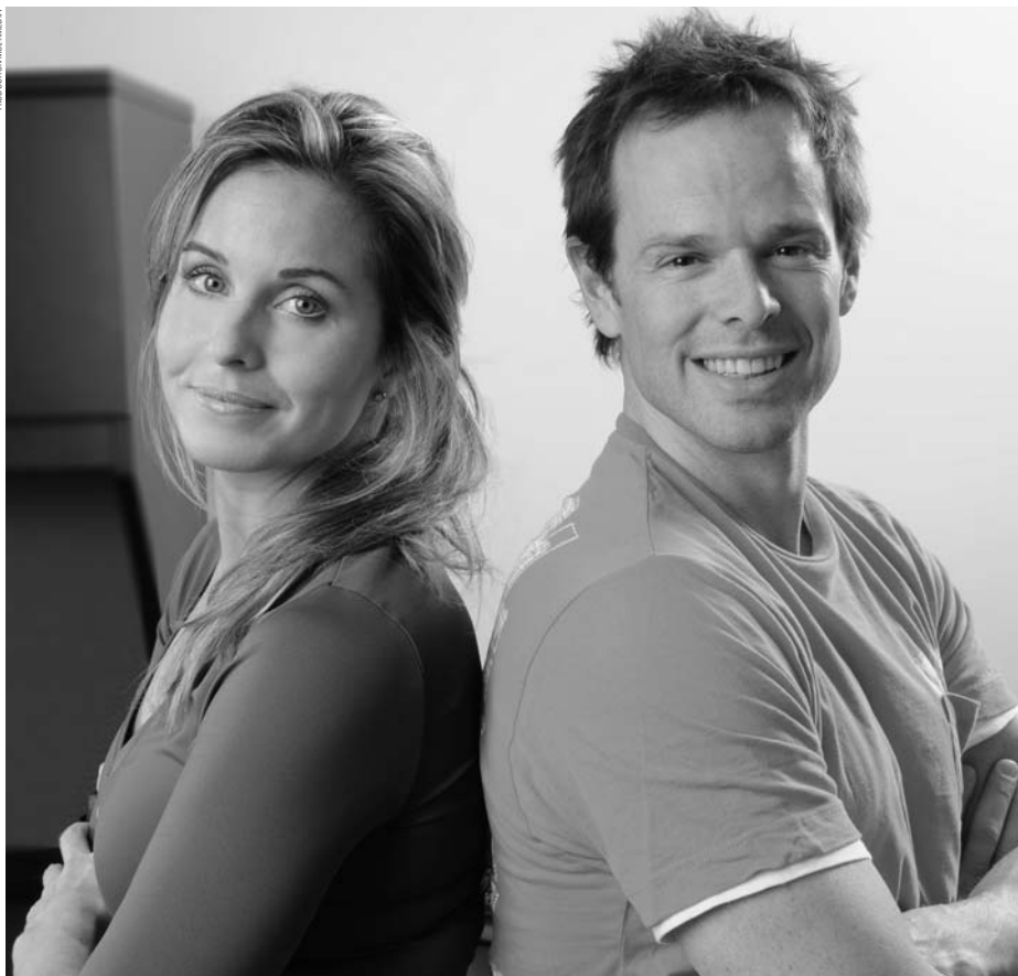
Des athlètes de renom pour nous inciter à bouger: Annie Pelletier et Jean-Luc Brassard

Dès 11 h, la journée semble éternelle? C'est le coup de barre de l'après-midi? Alors, le temps est venu de partager avec deux athlètes olympiques, Annie Pelletier et Jean-Luc Brassard, une courte séance d'exercice toute en douceur. Disponibles dans l'intranet, les capsules d'Annie et de Jean-Luc sont là pour vous ragailardir! Mieux encore, allez à l'icône CHUM Applications sur votre bureau, et cliquez directement sur Acti-Santé pour un accès plus rapide.