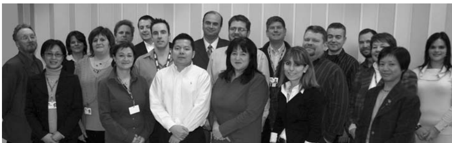
Les membres du comité de coordination et l'équipe de projet authentification unique et biométrie.

De mai à décembre 2006, plusieurs unités cliniques du CHUM ont testé un nouveau système d'authentification unique et de biométrie. Ce projet pilote visait à valider l'utilisation de ces technologies dans un environnement de soins afin d'assurer un accès sécuritaire aux documents confidentiels informatisés. Le projet pilote a été un succès grâce au travail d'équipes composées de membres de chaque direction du CHUM et, bien sûr, grâce au concours des cliniciens de ces unités. Un grand merci à tous !