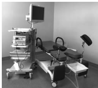
Les équipements neufs dans l'une des quatre nouvelles salles de cystoscopie (12 e Édouard-Asselin) grâce auxquels il est possible de visualiser l'intérieur des vessies.

soit le 5 e étage pour les cliniques externes et l'échographie prostatique, et le 12 e étage pour l'unité de cystoscopie et l'urodynamie. Cependant, sont maintenues à l'Hôpital Notre-Dame, les cliniques d'urologie oncologique (au centre d'oncologie du 4 e Deschamps) ainsi qu'une clinique externe (consultation et cystoscopie) à la clinique de chirurgie au rez-de-chaussée du pavillon Lachapelle.