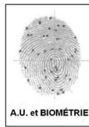
Lecteur biométrique: il reconnaît les empreintes de l'utilisateur et accorde l'accès

applications et la session de travail. Le vol d'identité ou d'empreinte digitale est pratiquement impossible avec la biométrie puisque ce n'est pas une image qui est conservée, mais une représentation mathématique à partir de laquelle on ne peut reproduire l'empreinte originale. Enfin, ce ne sera plus un casse-tête au retour des vacances de se rappeler de tous ses mots de passe. L'utilisation de la biométrie comme moyen d'authentification plutôt qu'un mot de passe est conseillée, mais laissée au choix de chacun. Les utilisateurs qui préfèrent ne pas utiliser la biométrie devront saisir un code d'utilisateur et un mot de passe en le tapant sur le clavier. La biométrie sera disponible sur tous les postes communs dans les unités de soins et dans les cliniques externes.