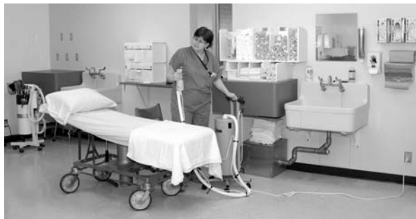
L'infirmière Diane Fortier dans la salle des plâtres entièrement rénovée de la clinique de chirurgie à l'Hôpital Notre-Dame.