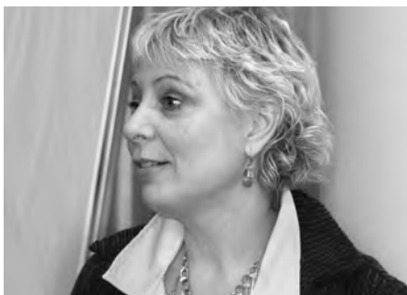
Une patiente témoigne.